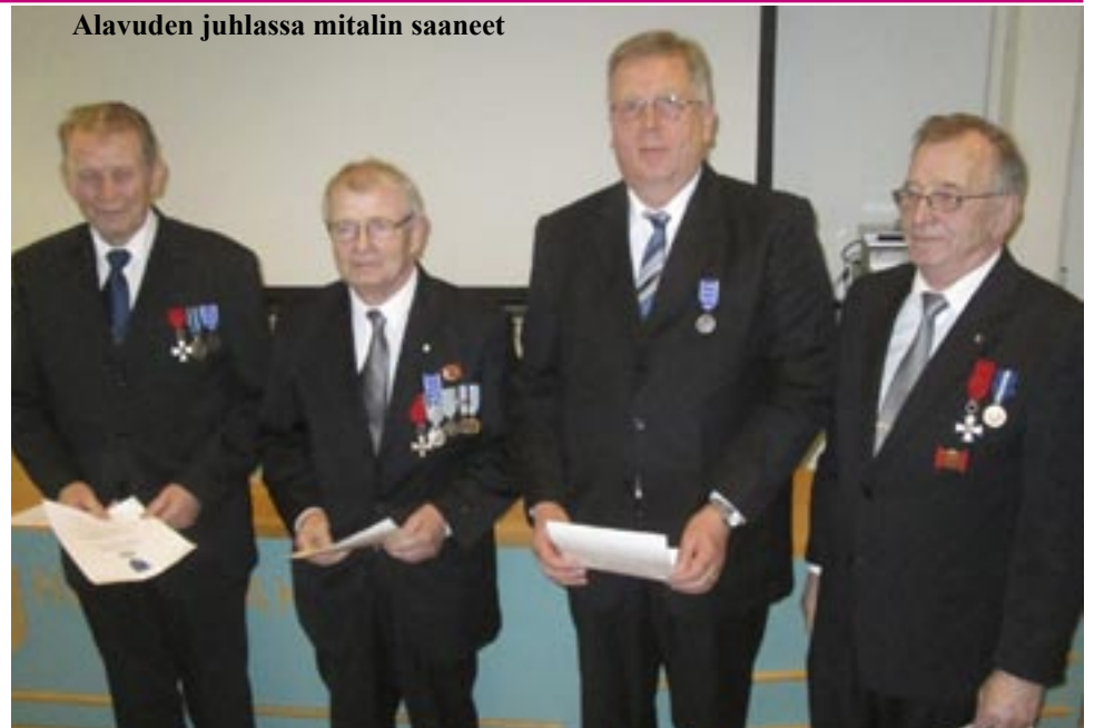
Alavuden juhlassa mitalin saaneet