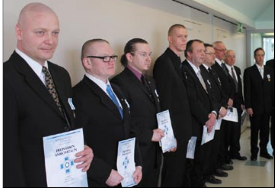
Reserviläisliiton hopeisen ja pronssisen mitalin saaneet.