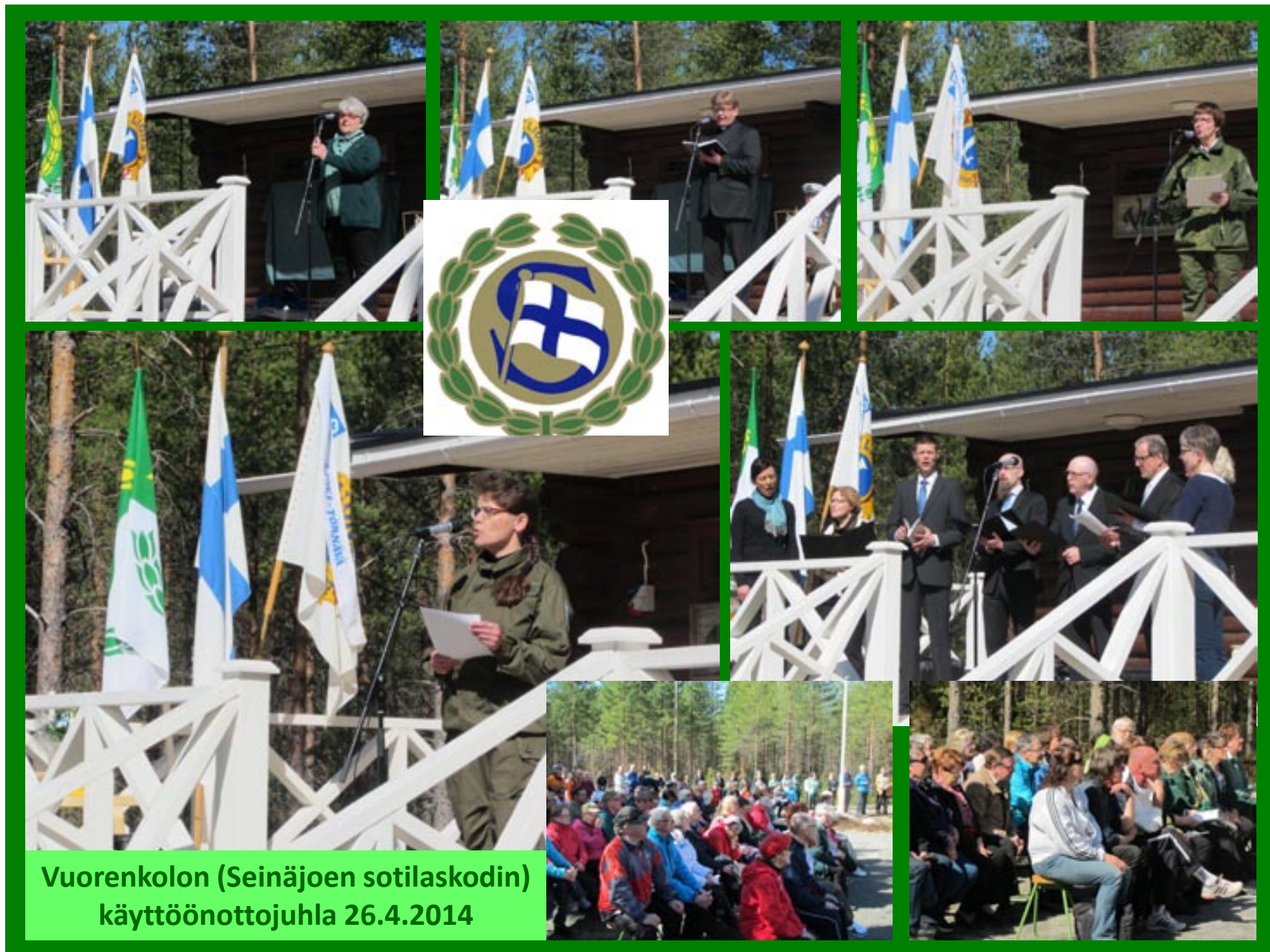
Vuorenkolon (Seinäjoen sotilaskodin) käyttöönottojuhla 26.4.2014